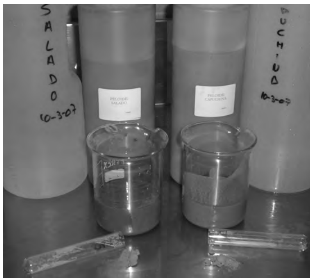
Figura 1: El peloide es obtenido por sedimentación. Sus sales se extraen por centrifugación y secado a temperatura ambiente.

Las aguas termales de dos de los manantiales del Balneario de Lanjarón: La Capuchina y El Salado, de fuerte mineralización, generan un peloide por sedimentación y evaporación de radón y CO 2 . (Figura 1) Sus composiciones son perfectamente conocidas y se muestran en la Tabla 1 . El agua de La Capuchina es clorurada sódica, cálcica, ferruginosa y carbogaseosa; mientras que la del manantial de El Salado es clorurada sódica, cálcica y ferruginosa, siendo su nivel de anhídrido carbónico más bajo por lo que no puede clasificarse como carbogaseosa. Se encuentran además en ambas trazas no despreciables de magnesio y litio. Por todo ello, los peloides de las aguas de estos manantiales parecen ideales en el tratamiento tópico de todo tipo de pieles sensibles que tengan necesidad de regeneración celular.