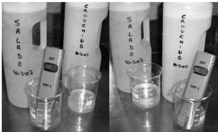
Figura 2: Determinación de la concentración osmótica de las sales de Capuchina (10,09) y Salado (1,60), que contrastan con la concentración isotónica para las células humanas (0,9% expresada en cloruro sódico).

Los queratinocitos también expresan canales para el calcio 11 , y este ión tiene influencia en la formación del cemento existente entre las células de la epidermis 12 . El cemento intercorneal determina el estado de la función barrera cutánea, y la disminución de la proporción de calcio intraepidérmico y del pH, son los principales factores influyentes en la mejora de la función barrera cutánea 13 .